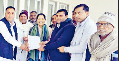
राई। ग्राम भैरा बाकीपुर के ग्रामीण विधायक को प्रस्ताव के विरोध व समाधान की कापी देते हुए।

ग्राम भैरा बाकीपुर के ग्रामीणों द्वारा विधायक को ज्ञापन देकर गांव की भूमि पर कुंडली क्षेत्र को जल आपूर्ति देने हेतु ट्यूबवेल व जल परियोजना स्थापित किए जाने के प्रस्ताव का कड़ा विरोध दर्ज कराया गया। ग्रामीणों ने विधायक को बताया कि ग्राम सभा की बैठक में सर्वसम्मति से प्रस्ताव पारित कर कुंडली क्षेत्र हेतु ग्राम की भूमि पर किसी भी प्रकार का जल परियोजना को अस्वीकार किया गया। ग्रामीणों ने बताया कि ग्राम की भूमि एवं भू-जल संसाधन वर्तमान एवं भविष्य