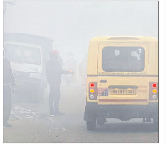
सोनीपत। ककरोई रोड पर छाया कोहरा।