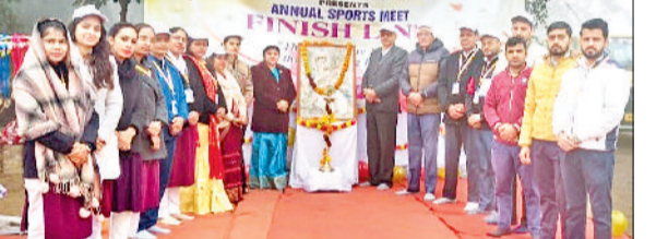
खरखौदा। कल्पना चावला विद्यापीठ में वार्षिक खेल समारोह का आयोजन बड़े ही उत्साह और जोश के साथ किया गया।