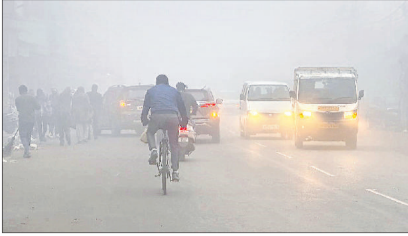
सोनीपत। तिरंगा चौक के पास कोहरे के बीच चलते वाहन।