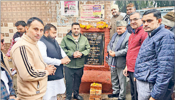
सोनीपत। विकास कार्यों का शुभारंभ करते हुए विधायक साथ में मेयर एवं अन्य।