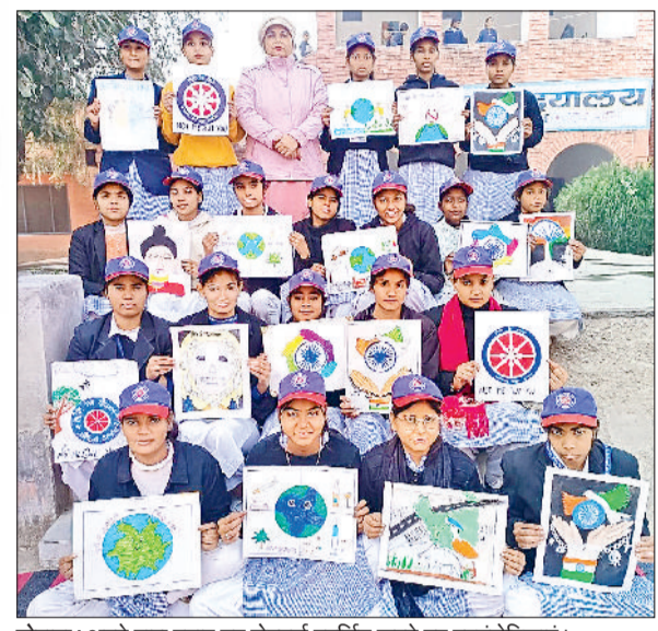
गोहाना। अपने द्वारा बनाए गए पोस्टर प्रदर्शित करते हुए स्वयंसेविकाएं।