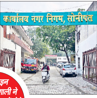
कार्यालय नगर निगम, सोनीपत

इस साल सोनीपत नगर निगम ने अपनी कार्यप्रणाली में बड़ा डिजिटल बदलाव किया। अंत्योदय 2.0 के क्रियान्वयन से सरकारी योजनाओं का लाभ सीधे पात्र व्यक्तियों तक पहुंचना शुरू हुआ। इससे पहले की व्यवस्था में बिचौलियों का बोलबाला रहता था लेकिन नई तकनीक ने इस दीवार को गिरा दिया है। अब पात्र परिवारों को अपनी सुविधाओं के लिए किसी दलाल के चक्कर नहीं काटने पड़ते। इसी तरह आनलाइन रजिस्ट्री प्रणाली ने संपत्ति के खेल में